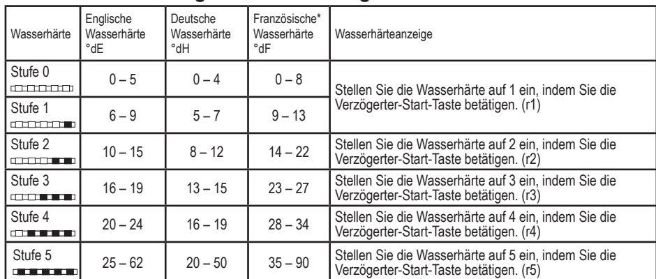
Tabelle zur Einstellung des Wasserhärtegrades